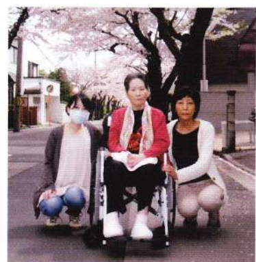
桜が丘通・お花見