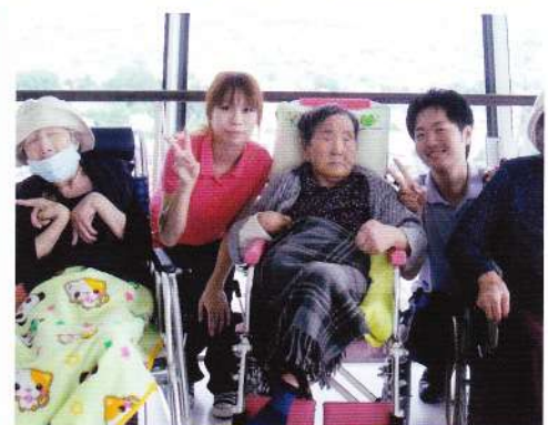
五稜郭タワー・ドライブ