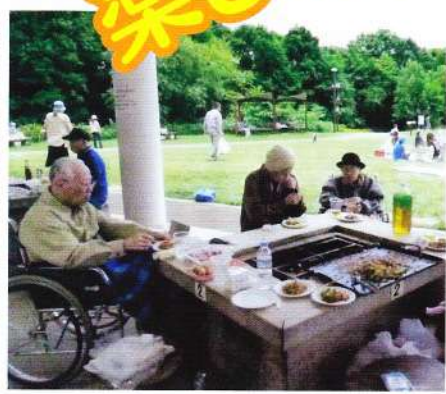
四季の杜公園・バーベキュー