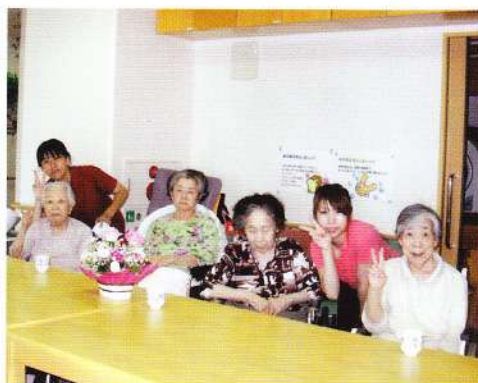
ヒヨドリユニット誕生会