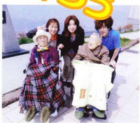
函館山・ドライブ