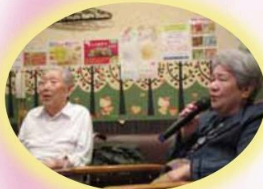
カラオケボックス