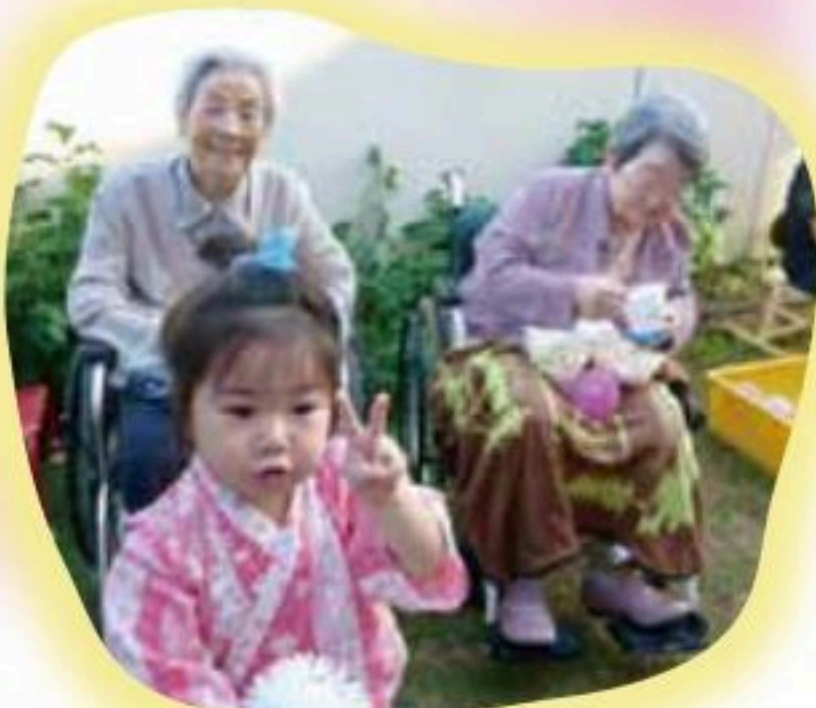
こども園の縁日ごっこで