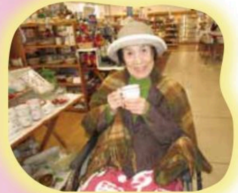
このカップにしようかしら