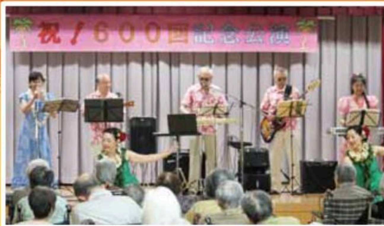
ファイブエコーズとマイレ本間星川教室の皆さん

福祉施設訪問演奏600回を達成され、愛泉寮で記念公演が開催されました。ハワイ音楽や懐メロをウクレレやスチールギターで奏でるメロディに、マイレ本間星川教室の皆さんのフラダンスが加わり南国気分を満喫する事ができ、惜しみない拍手が鳴り響いていました。