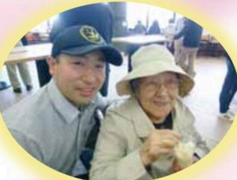
競馬場で楽しんだ後のひととき