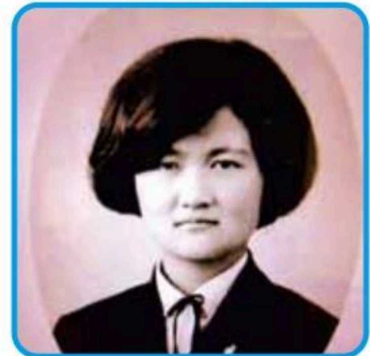
看護課の方です。高校生の時の写真で、 マンドリンクラブに入っていました。