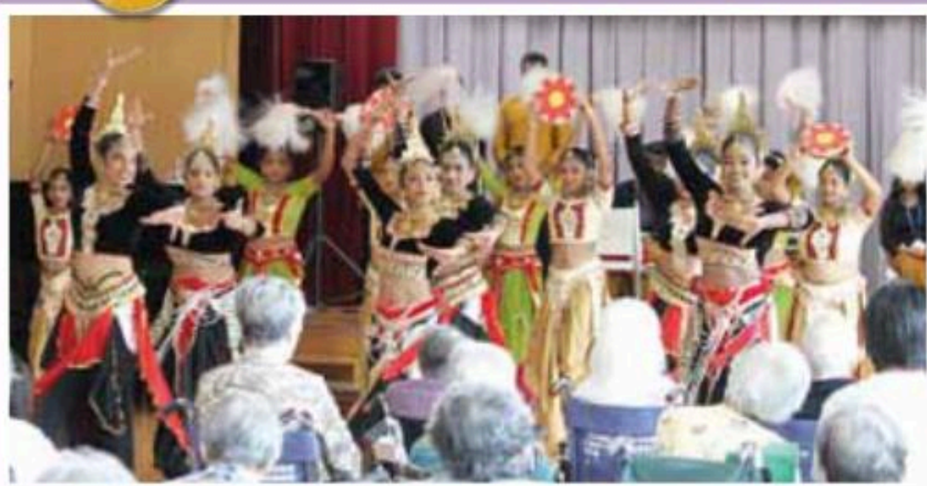
華麗な踊りと音楽を披露