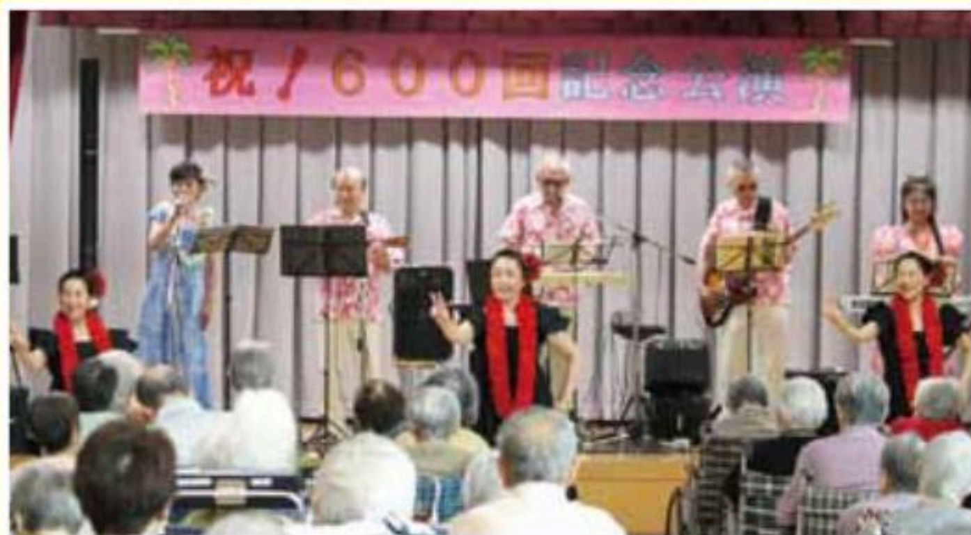
マイレ本間星川教室の皆さんによる優雅なフラダンス