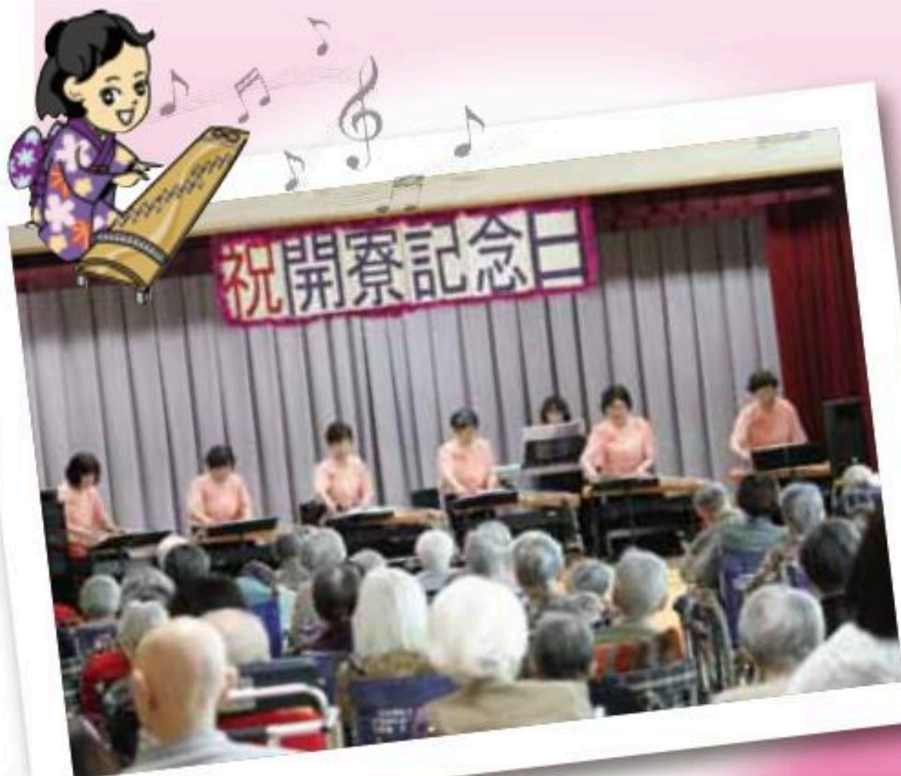
函館ドリーム琴 アンサンブル 「春風コンサート」