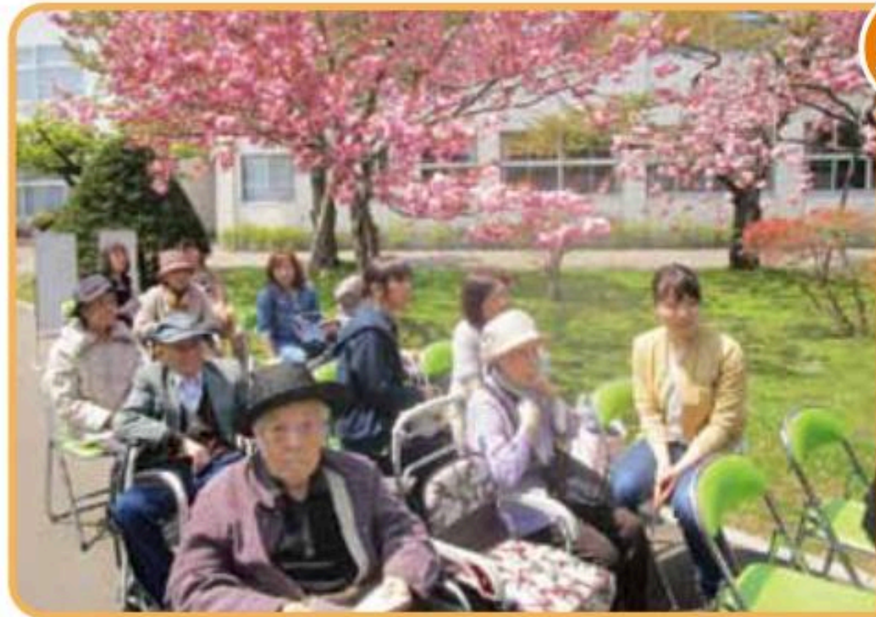
満開の桜で楽しめました。