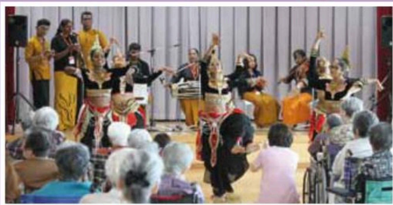
国際インド女性舞踊コンテストおよびユドバブ国際舞踊祭で優勝