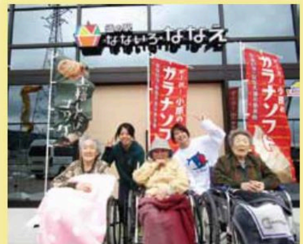
今年オープン七飯 道の駅