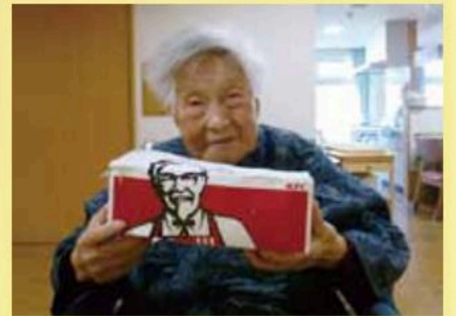
103歳! 私の好物ケンタッキー