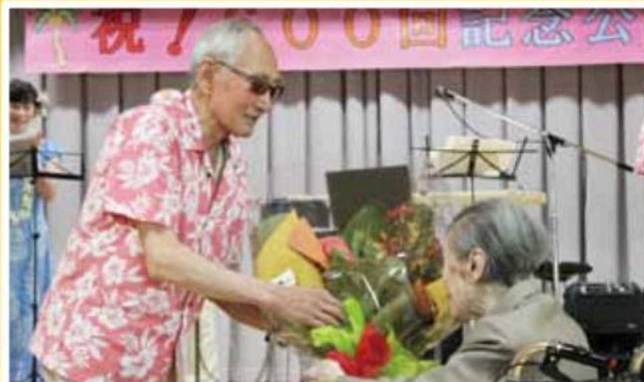
福祉施設訪問600回を記念して花束贈呈