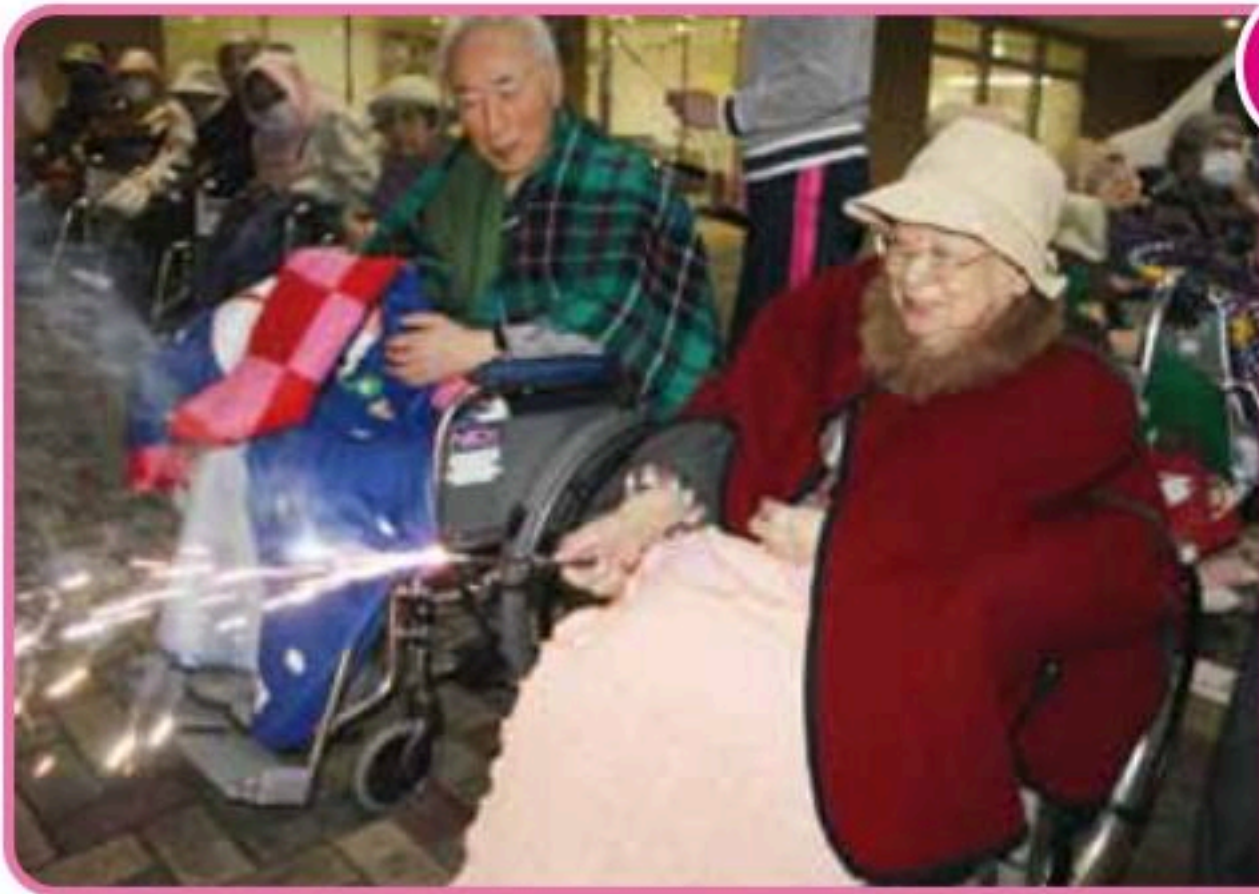
いろんな花火を楽しみました。