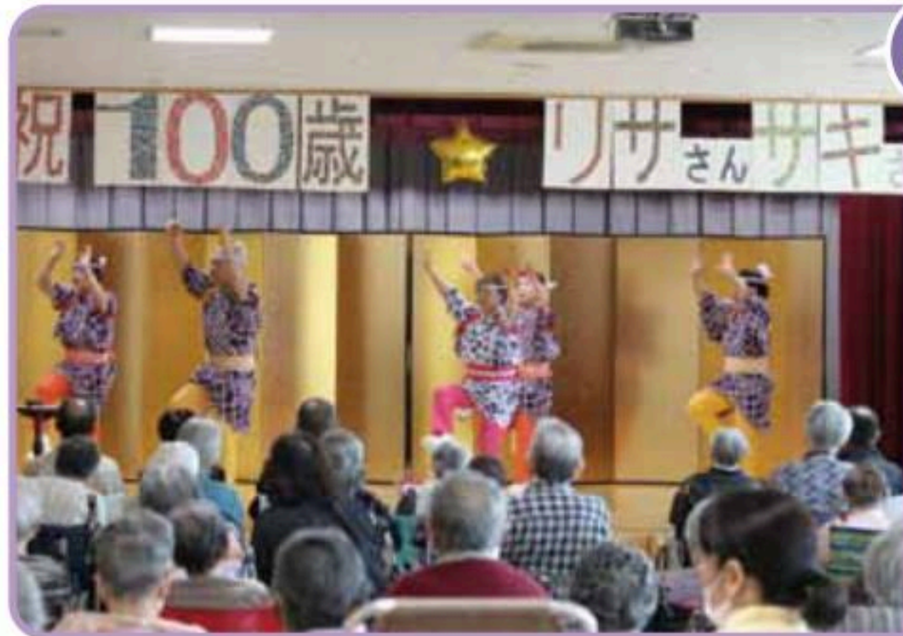
櫻川流 江戸芸かっぽれ 函館有香里会訪問