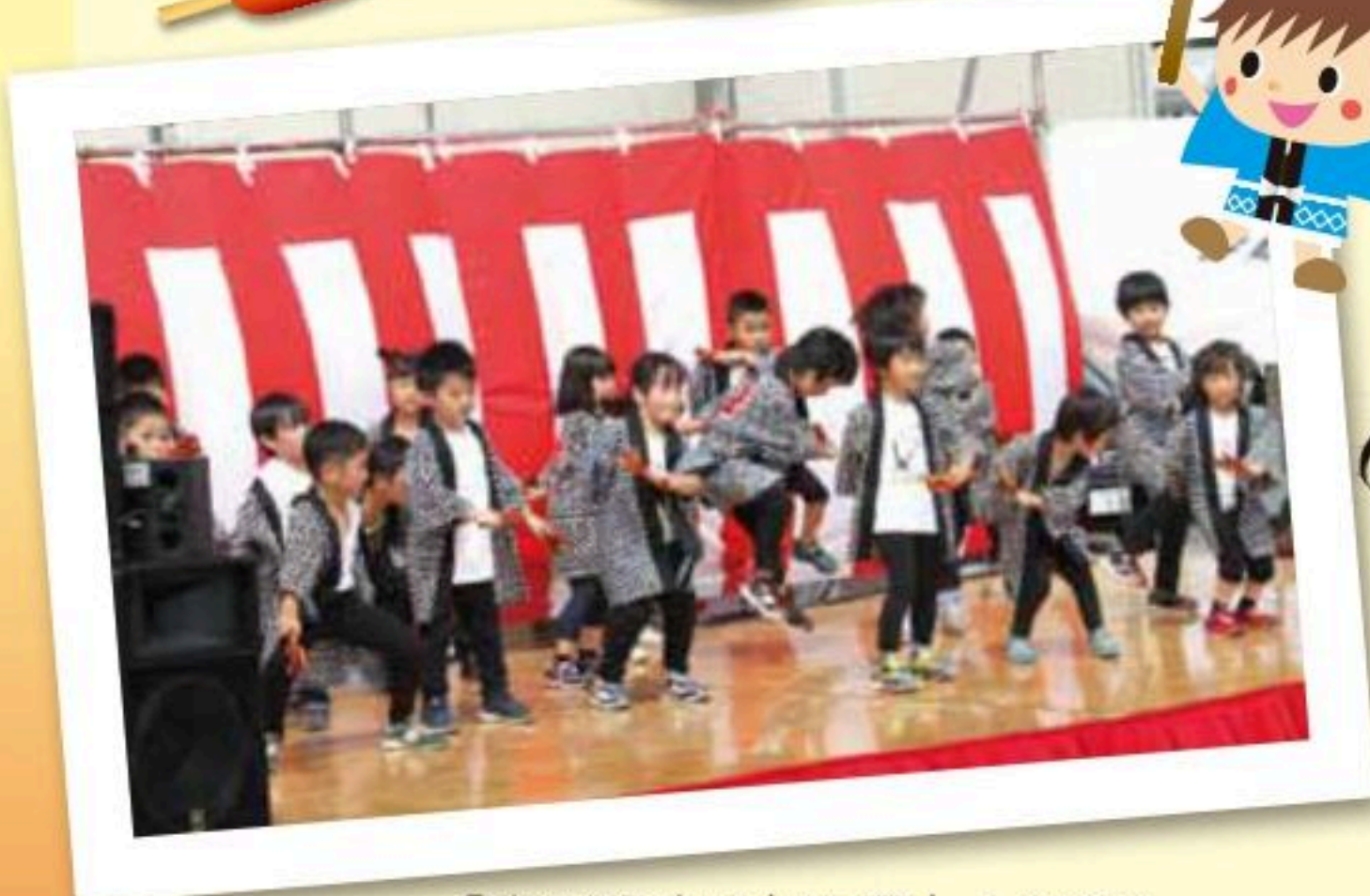
「赤川認定こども園」よさこい