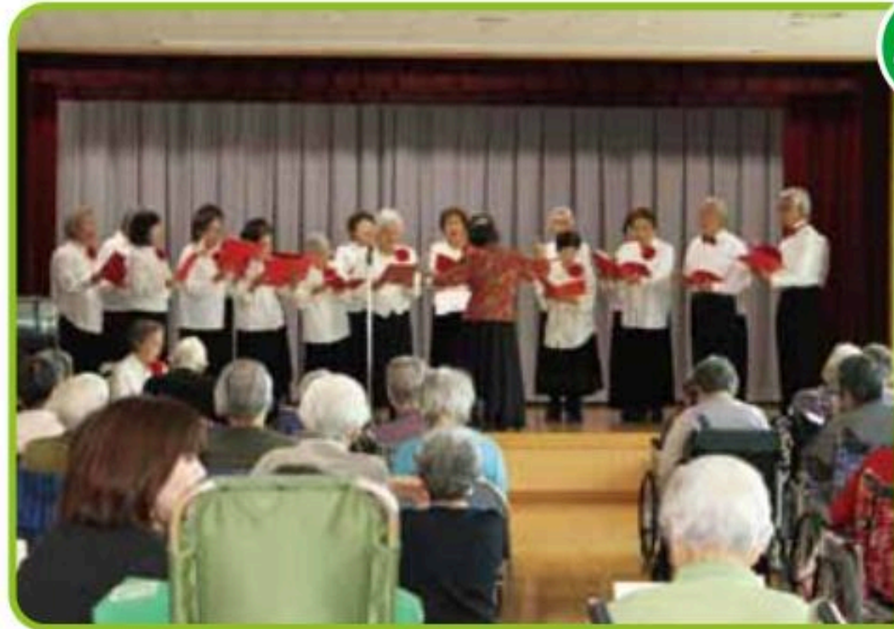
皆で楽しく大合唱!