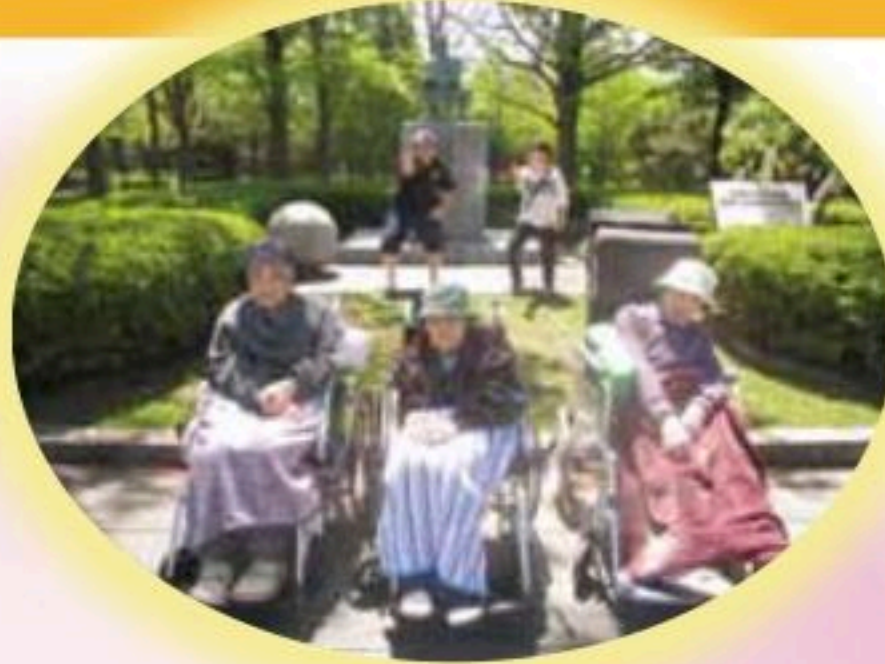
千代台球場へお散歩