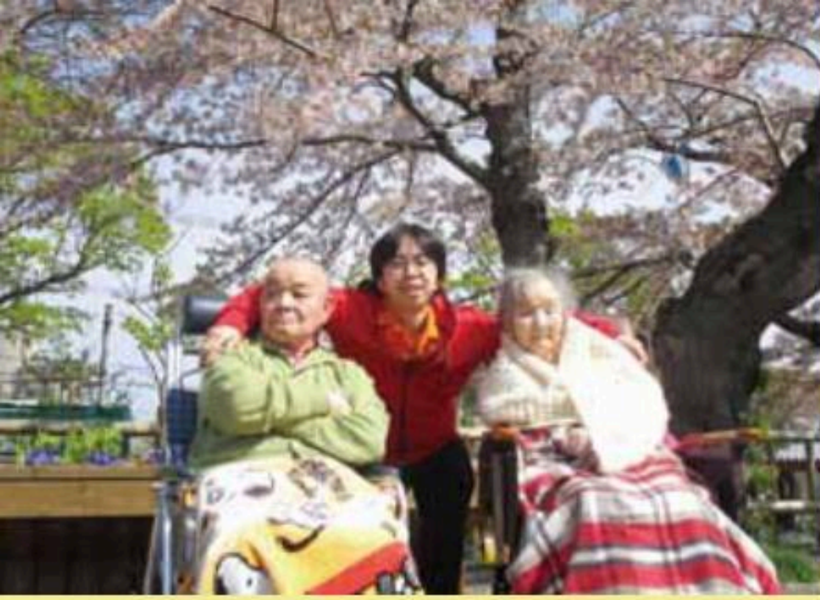
函館公園でお花見