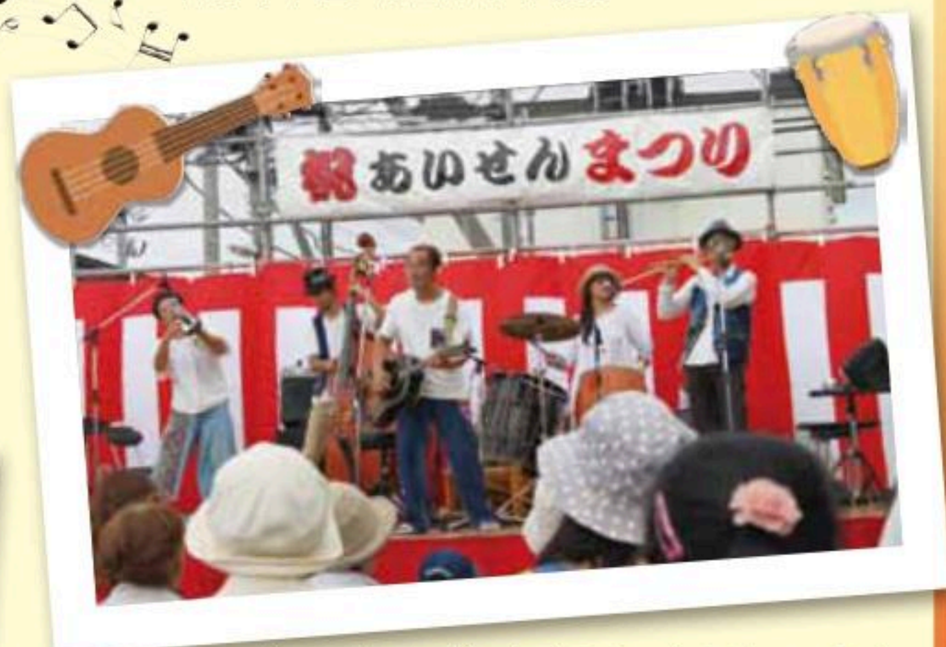
「トラベリングバンドひのき屋」ライブ