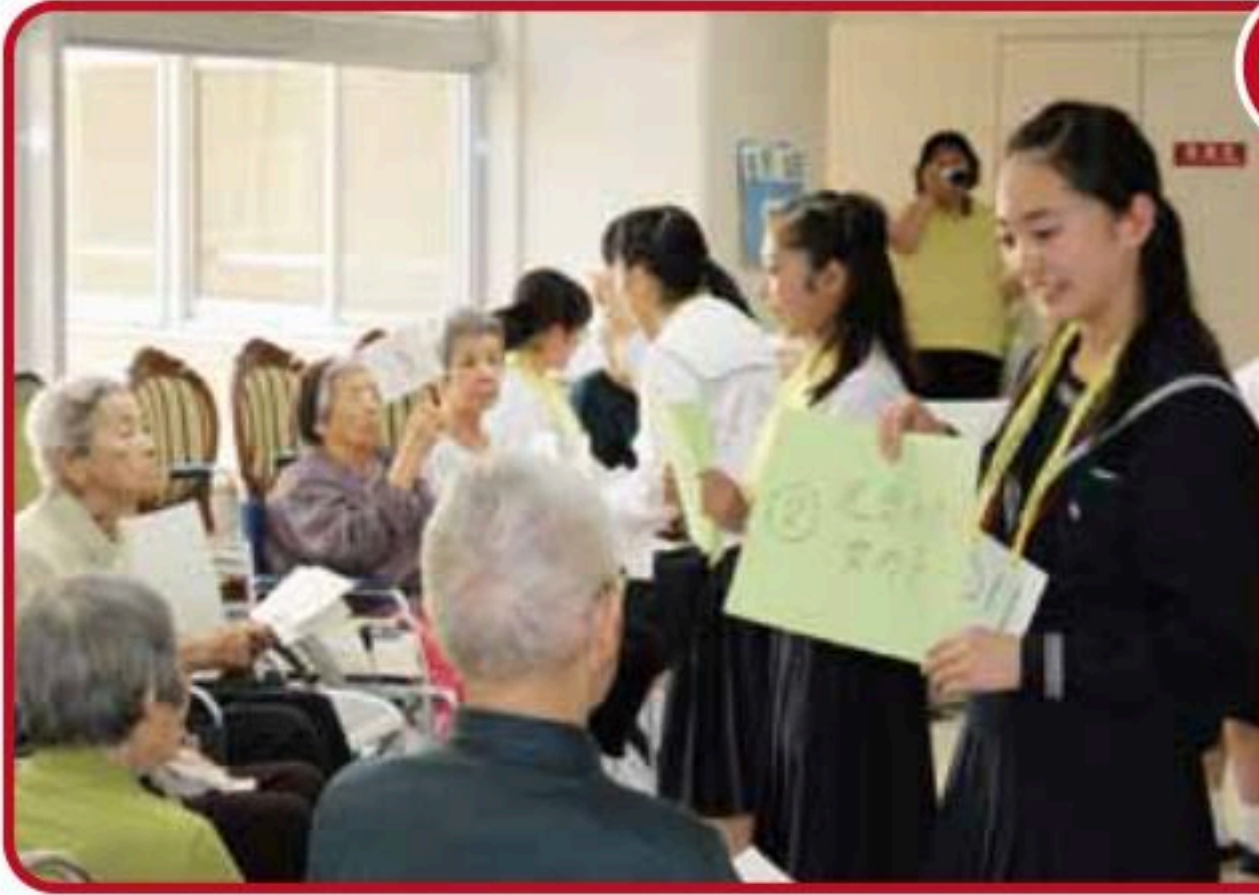
入居者とゲームで交流!楽しかった～