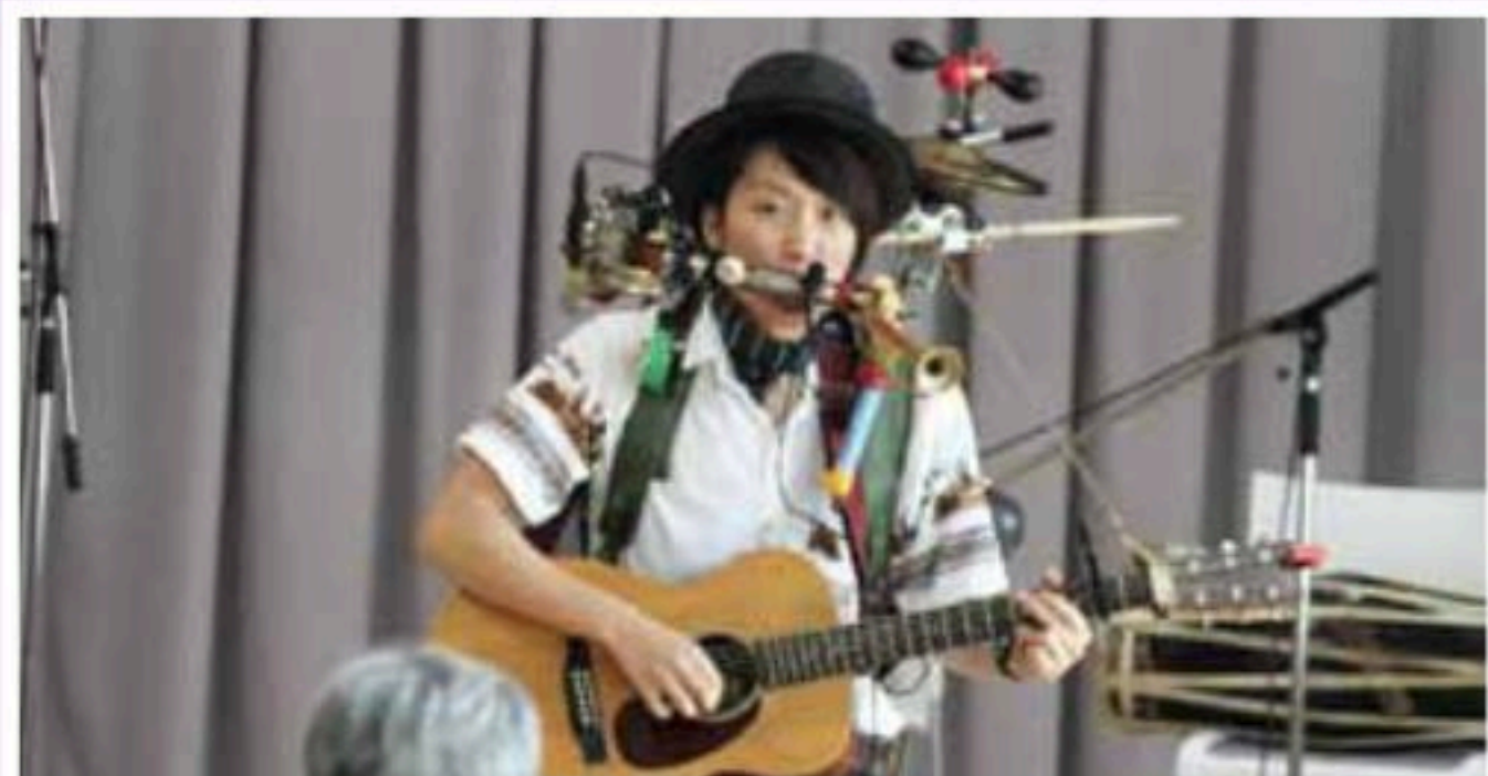
ドラムとギターとハーモニカなど全11種類の楽器をたった1人で同時演奏