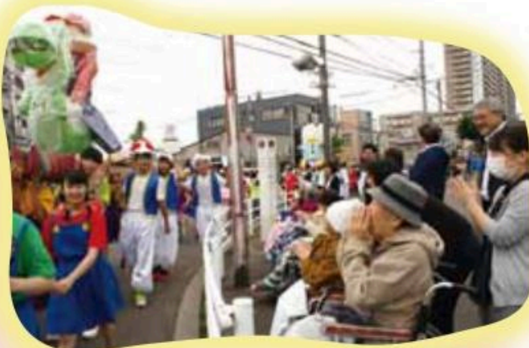
市立函館高校行燈行列応援