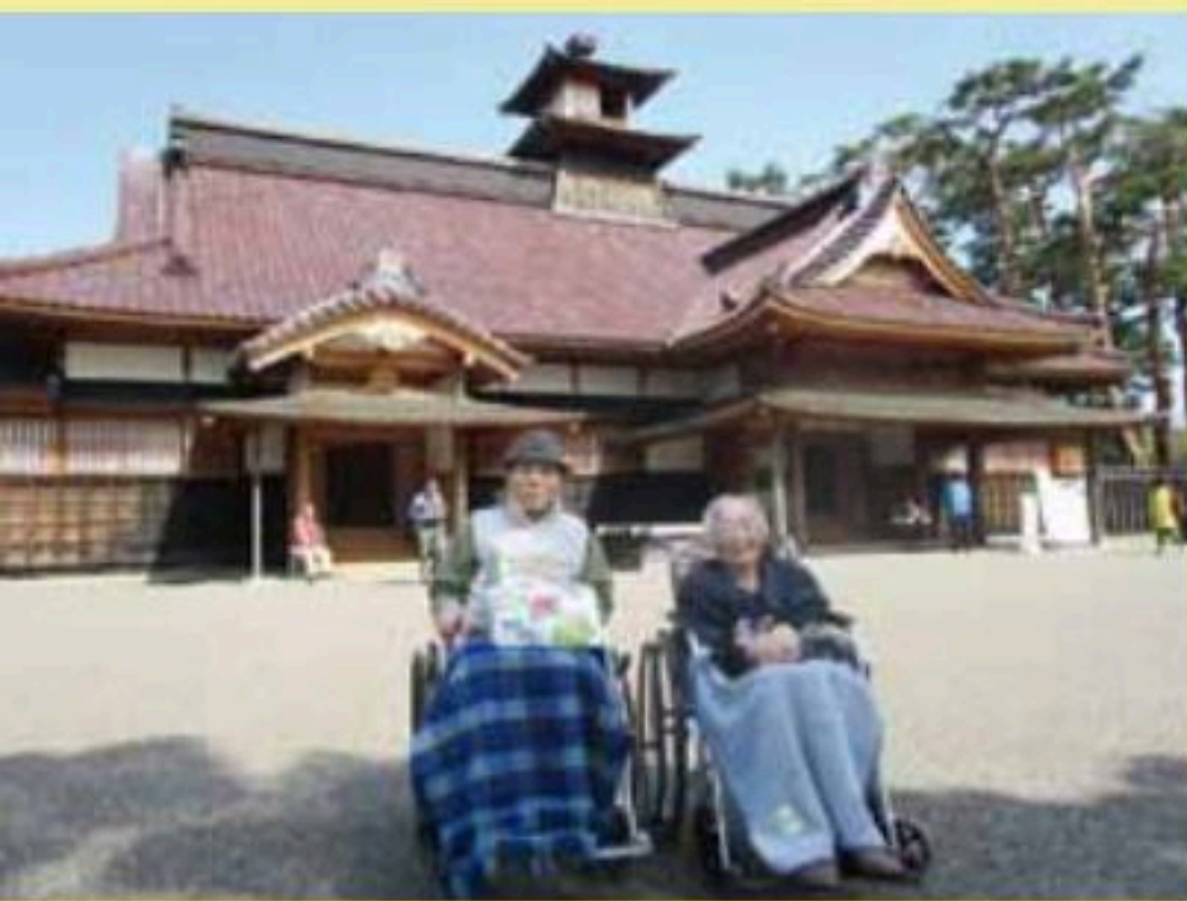
五稜郭公園で散策