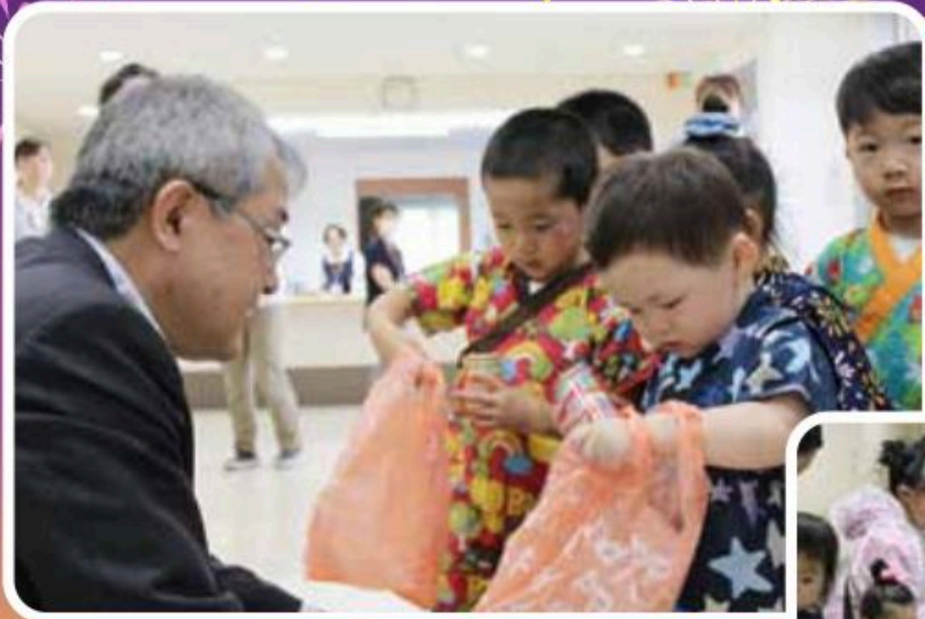
ジュースをもらったよ