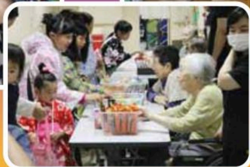
お菓子がいっぱい!