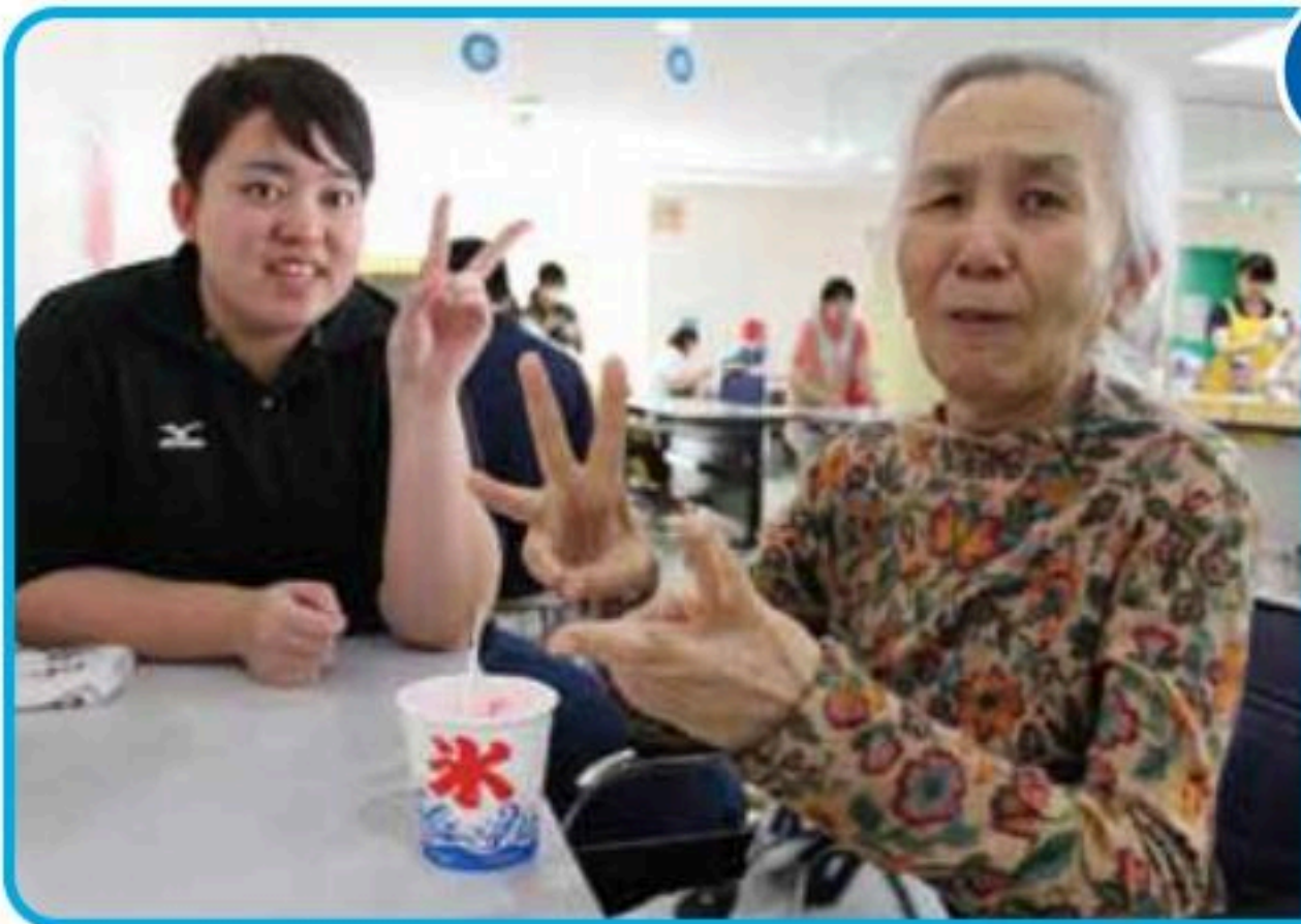
冷たいけど美味しい!