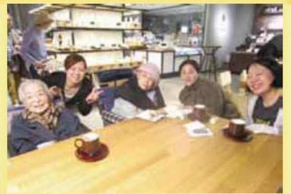
シエスタで女子会