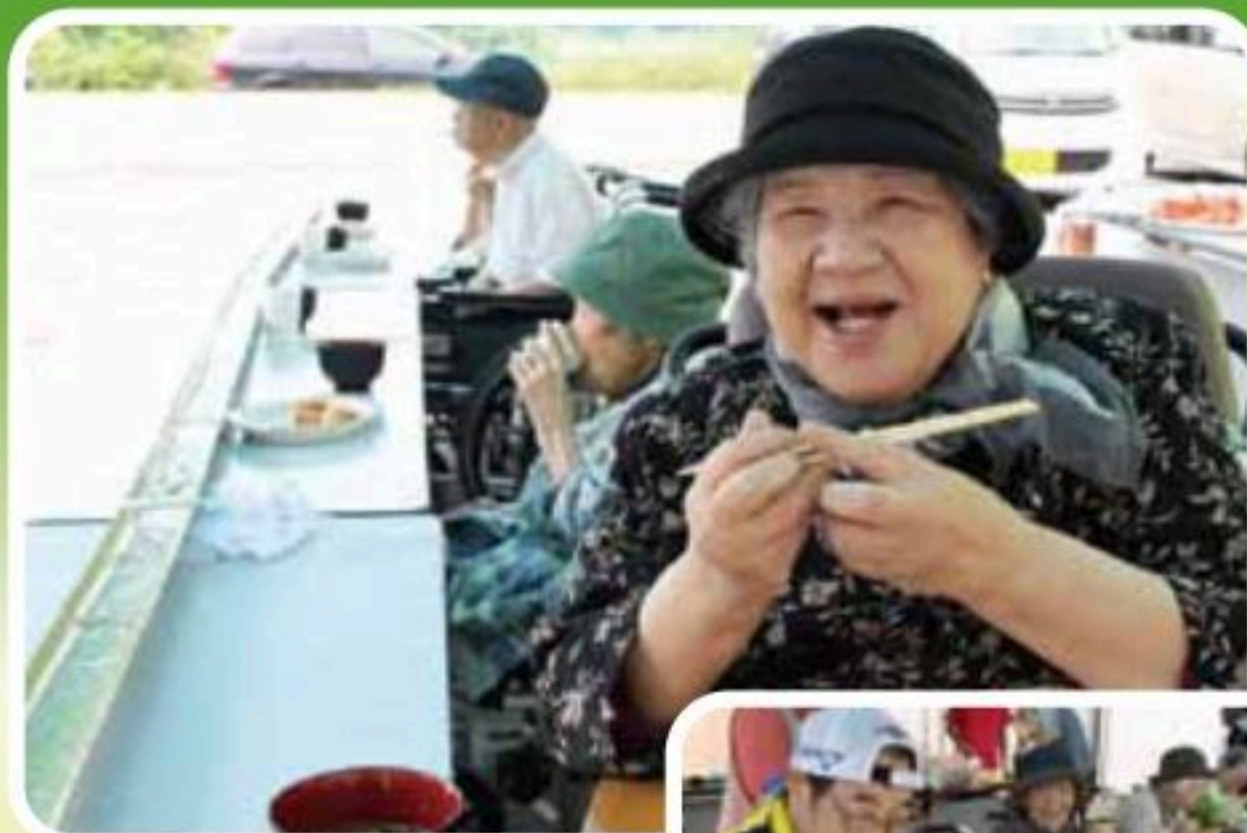
夏はやっぱりそうめんね