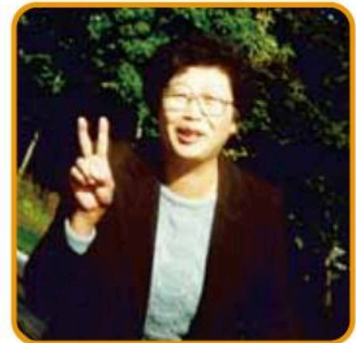
3階ヒバリユニットにいる女性です。 ご夫婦の仲が良く、旦那さんがよく いらっやっています。