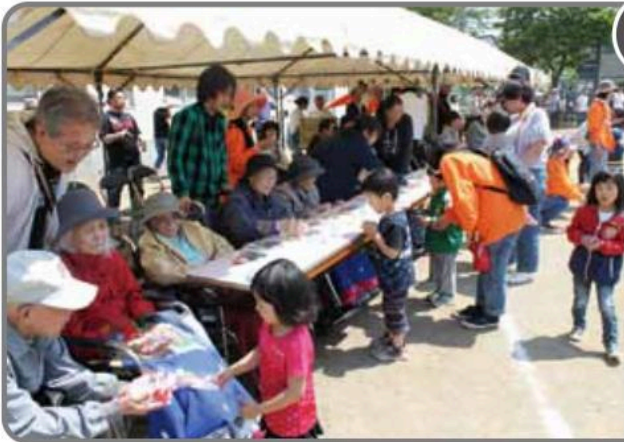
一生懸命応援しました!