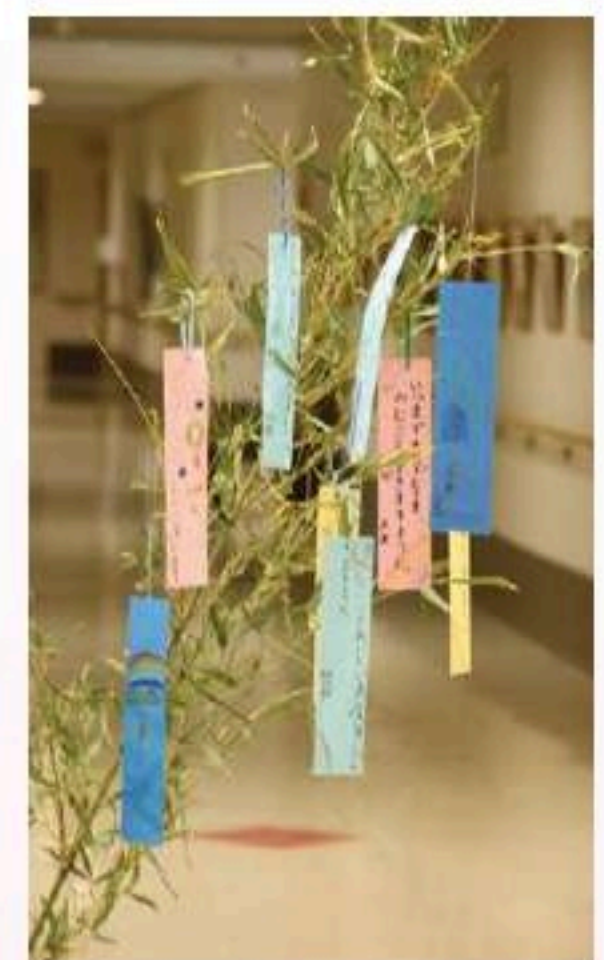
中島小学校の児童が短冊に入所者の願い事を代筆してくれました。