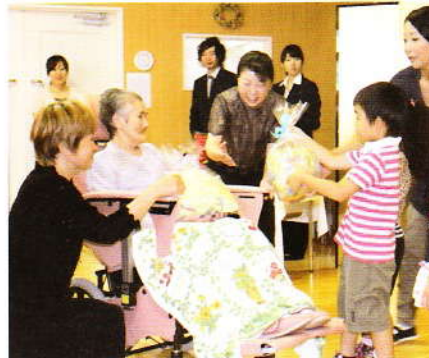
9月 敬老会 入居者の皆様、 おめでとうございます！