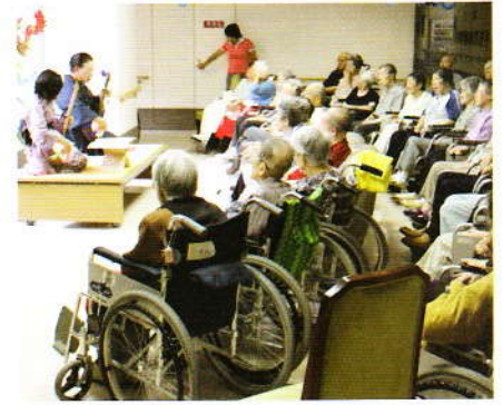
8月 長唄ミニコンサート 素敵な音色でした