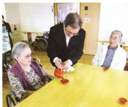
1月 新年居室訪問 今年も一年、健康で過ごせ ますように