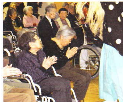
1月 新年交礼会 獅子舞に頭を噛んで もらいました！