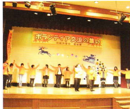
11月 ボランティア交流の集い ボランティアの皆様 いつもありがとうございます