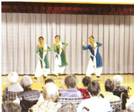
8月 はこだて国際民俗 芸術祭訪問 インドの方の踊りに魅せ られました