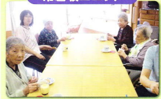
お茶会 話に花が咲きました✽