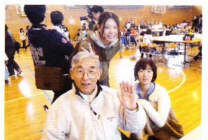
10月 中島まつり in 中島小学校