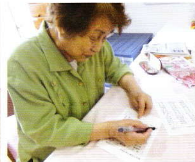
次なる優勝を狙います!