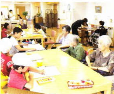
9月 似顔絵大会 in 愛泉寮