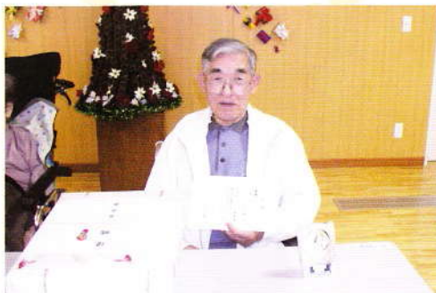
第263回優勝者 蔵間山!!