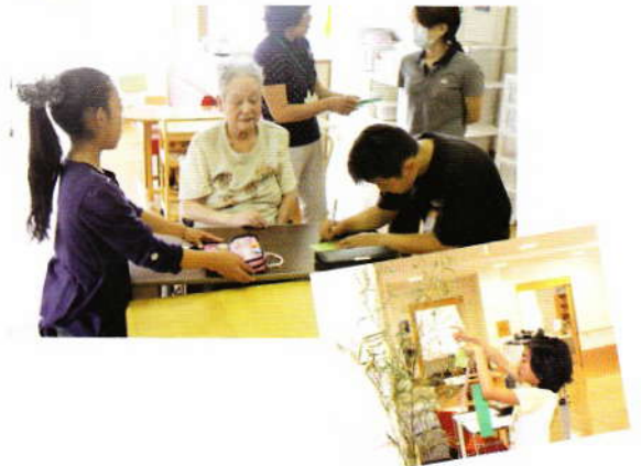
7月 七夕の短冊書き in 愛泉寮