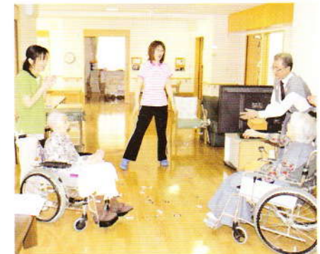
2月 節分 鬼は外、福は内～！