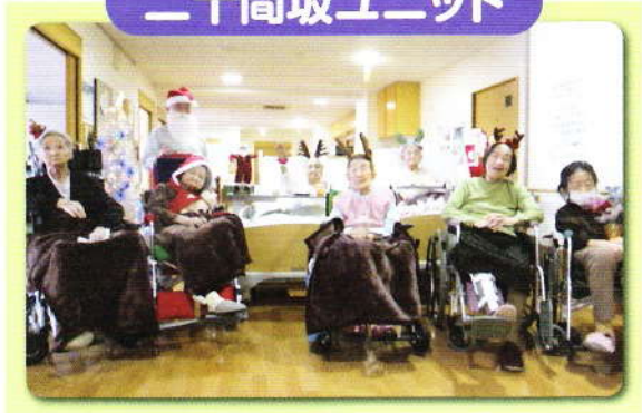
クリスマス会 クリスマス気分を味わいました!!