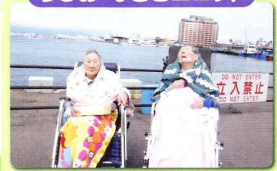
ドライブ 海風に吹かれて気持ちよかったです!!