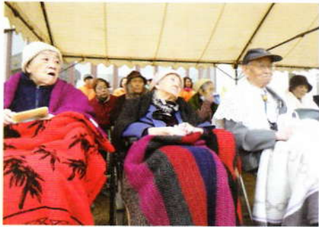
6月 運動会応援 in 中島小学校