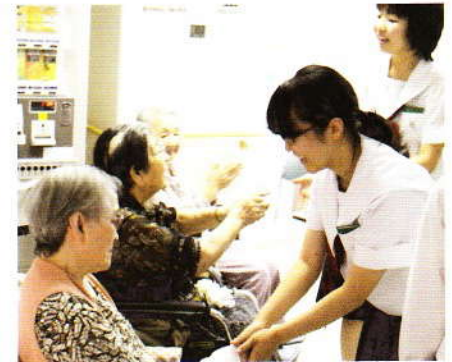
9月 遺愛中学生訪問 ゲームで交流しました