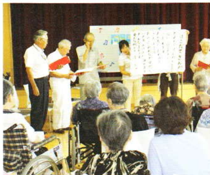
10月 函館相生教会有志の会 ミニコンサート 歌ったり、 指あそびもしました