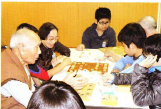
11月 5年生との交流 in 愛泉寮