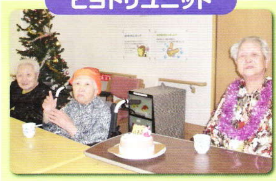
クリスマス会 皆でアイスクーキを食べました!!