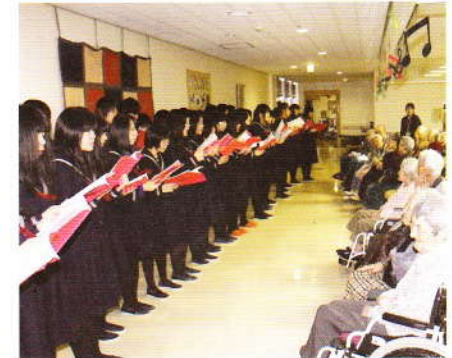
12月 遺愛学院キャロリング 美しい歌声でした