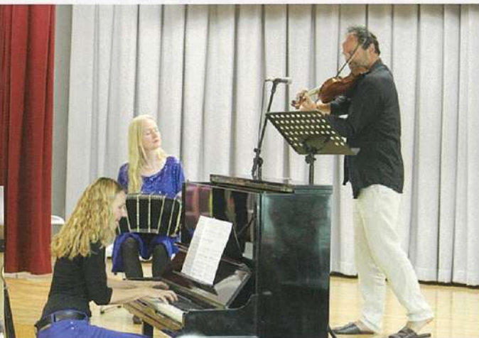
「ラ・ピシクレータ」(ドイツ)

魅力的で伝統的なタンゴ、バンドネオン、バイオリン、ピアノによる演奏が現代的タンゴの神髄へと深く聴衆を導きます。