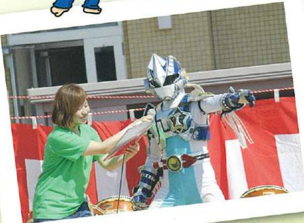
函館鮮士イカダベッサー参上!!