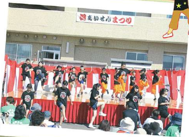
「A☆D☆Sエアロ・ダンス・サークル」