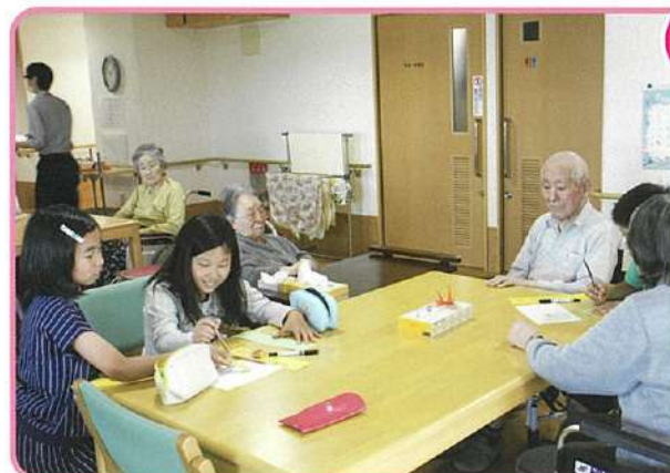
7月 中島小学校短冊書き訪問