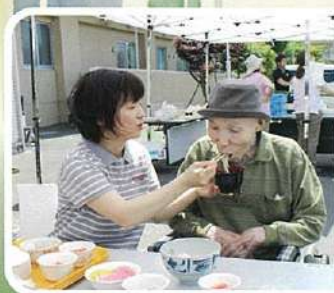
外で食べるそうめんは 美味しい!!