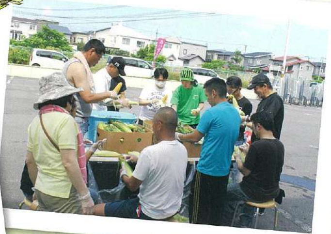
陸上自衛隊函館駐屯地函館曹友会の皆さんにと うきみの皮むき、テント設営等、会場準備の 協力をいただきました。