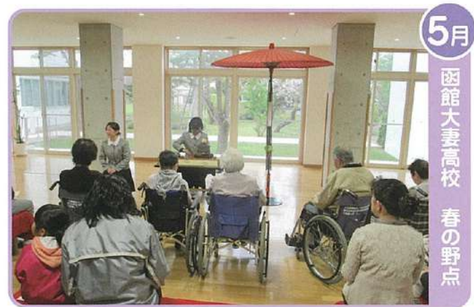
5月 函館大妻高校 春の野点

大会コースとなっている愛泉寮横の沿道でコースを駆け抜けるランナーに声援を送りました。