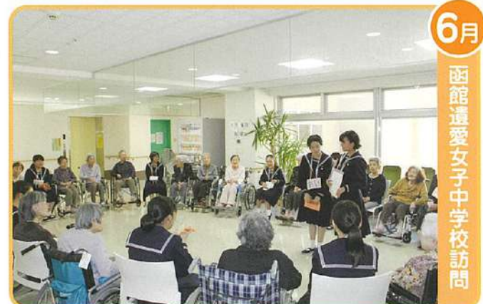
6月 函館道愛女子中学校訪問