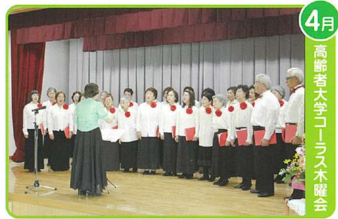
4月 高齢者大学コーラス木曜会