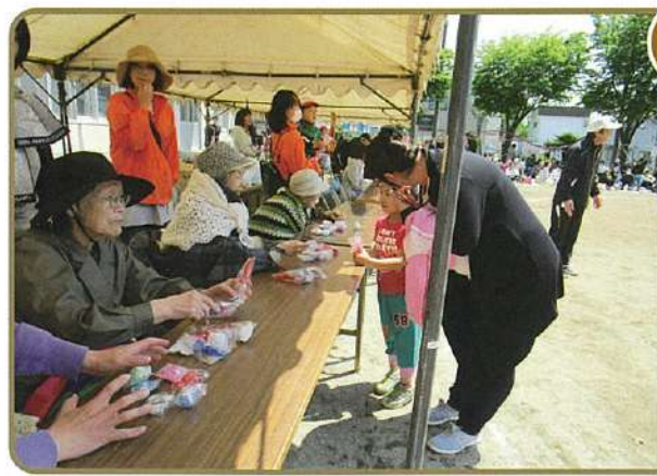
6月 中島小学校運動会応援