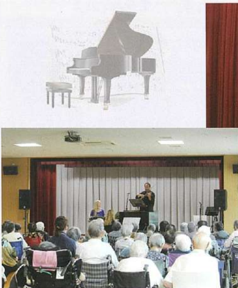
バイオリンの音色が会場に響きわたります

オーストラリアの個性的な音楽家の一人ミリアム・リーバーマン、フルート奏者のアグネスチャン・スプリャトナによる演奏。クラシックバイオリン、インディアンフルート、西アフリカの伝統楽器「コラ」を自然に融合させた演奏が魅力です。