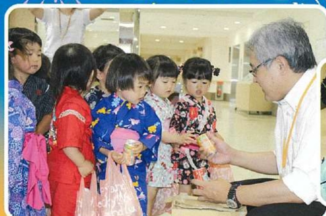
ジュースをもらったよ♪