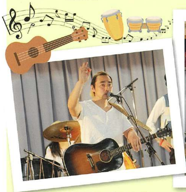
多彩なオリジナル曲で会場が一体に!