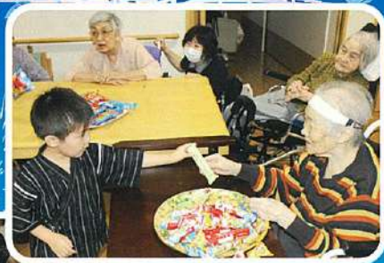
どうもありがとう♪