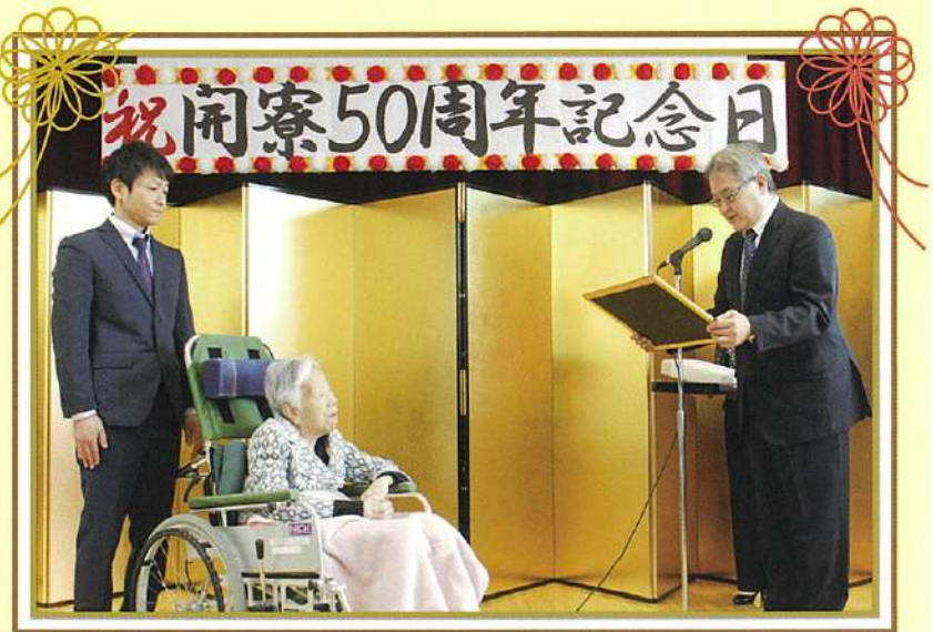
永年在寮表彰 記念品と表彰状を贈呈