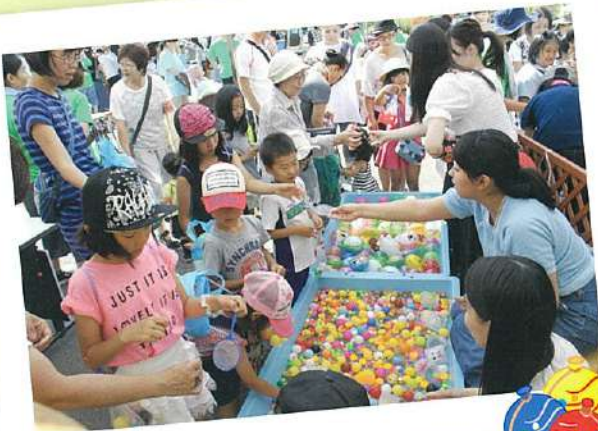
遊びの広場♪くじ、ヨーヨー釣りコーナー