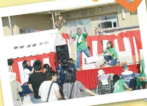
山石施設長より来場者へお菓子撒き