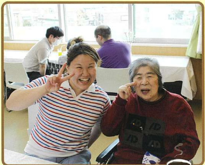
午後からは喫茶室でコーヒータイム!