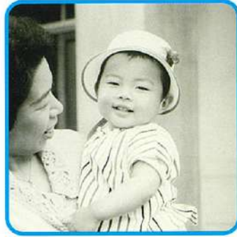
看護師の女性で、1歳くらいの頃の写真です。今も変わらないのですね！わかるかも？