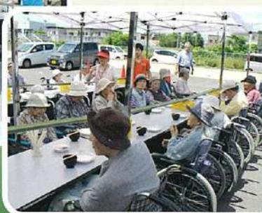
今年も流しそめんの 開催です♪