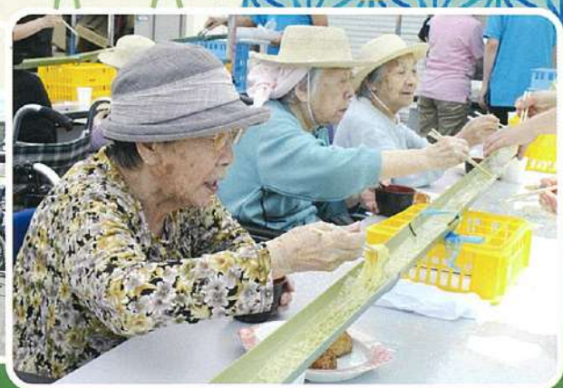
そうめん酒み損ないように