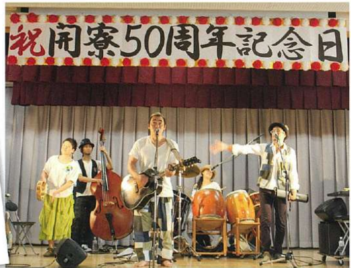
トラベリングバンド「ひのき屋」