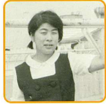
2階の幸坂にいらっしゃる女性です。ご家族様と一緒に散歩をされていることが多いです。