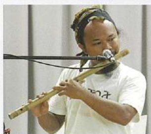
インディアンフルート

全国各地、世界各国から約40組のアーティストが参加し、会場内各所に設けられたステージでパフォーマンスが繰り広げられます。