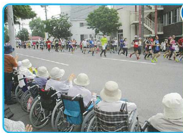
6月 函館マラソン応援

大会コースとなっている愛泉寮横の沿道でコースを駆け抜けるランナーに声援を送りました。