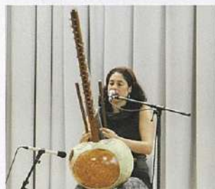
西アフリカ伝統楽器「コラ」