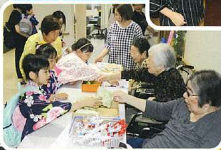
たくさん食べたかな？