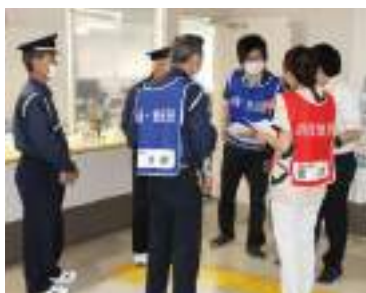
訓練前に入念な打合せです

6月26日、春季の訓練を実施しました。新型コロナウイルスの影響を受けて密集を避けるため、新たな内容は取り入れませんでした。夜間、勤務者が少ない中でどのように職員間連携をとるかを確認しながらの訓練をすることが出来ました。