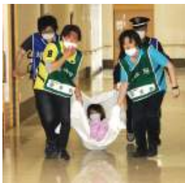
歩行困難者を避難している様子