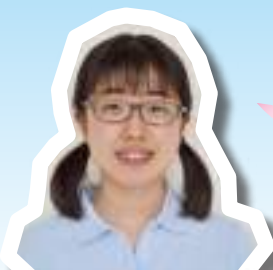
うらかみ あい 浦上 愛 (フクロウ)