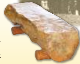
1階エレベーター前に設置しております

その郷愁をもって広報誌の誌名が「ポプラ」となった。その後愛泉寮をずっと見守ってきたポプラも平成24年、道路舗装のため、全て切り倒されてしまった。このベンチは平成元年に切り倒されたポプラで作成されており、愛泉寮創立以来、寮の移り変わりを現在も見守り続けている。