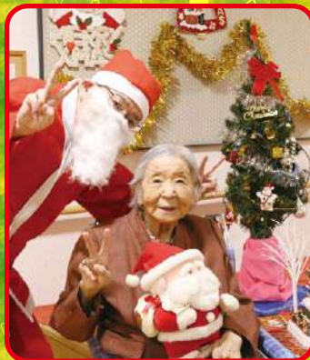
ポーズをとって、 はい「チーズ」