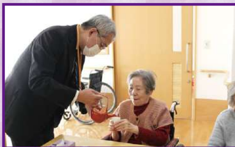
明けましておめでとうございます