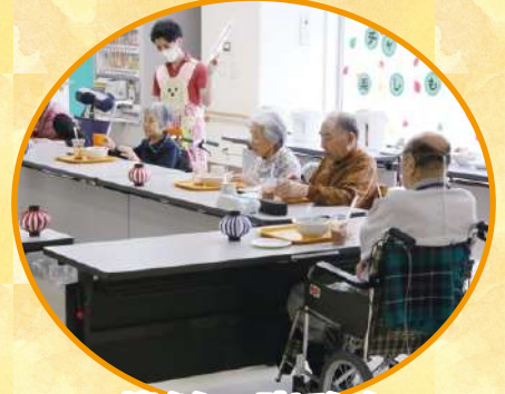
懐かしい味でした