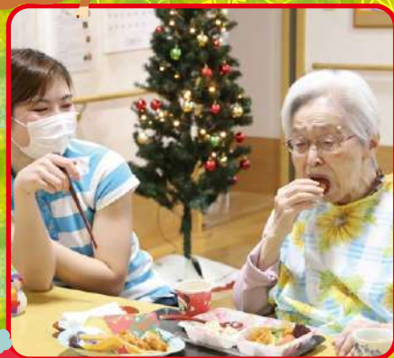
ゆっくり食べてね