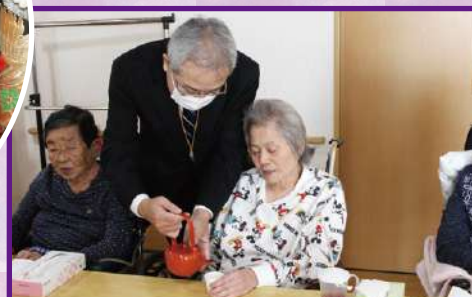
今年もよろしく願います