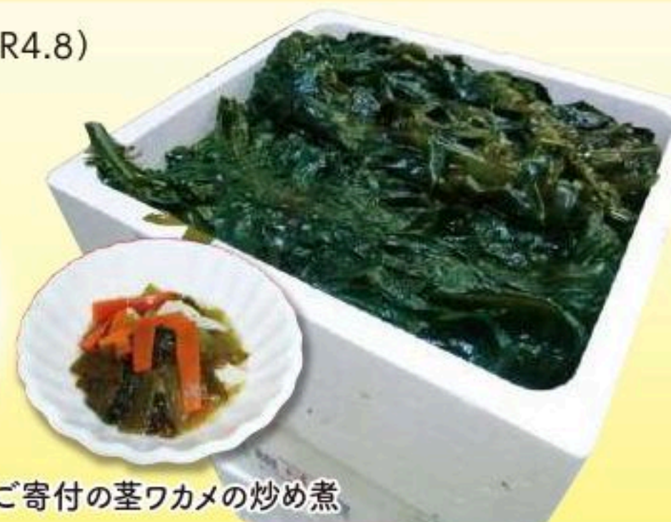
ご寄付の茎ワカメの炒め煮

新鮮な生ワカメや昆布を頂きました。余すところなく、茎ワカメの炒め煮も提供させて頂きました。柔らかく美味しかったです。