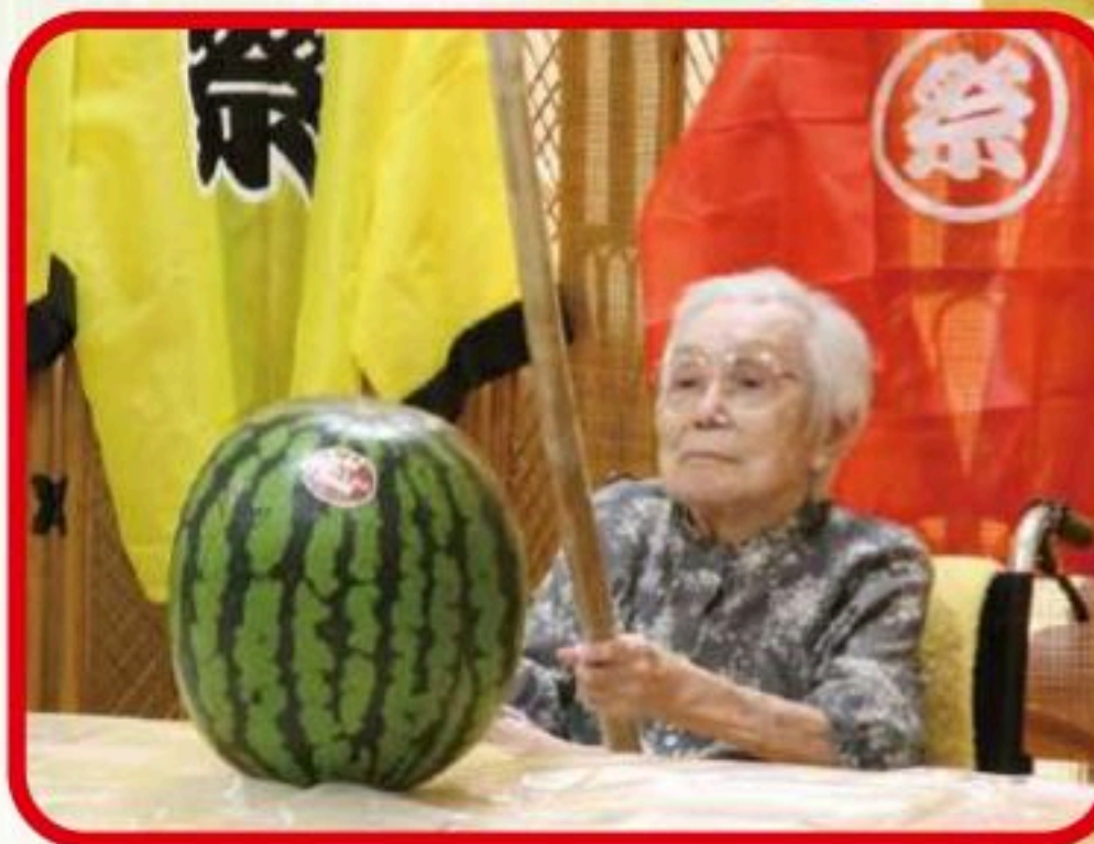
これから割りまーす!