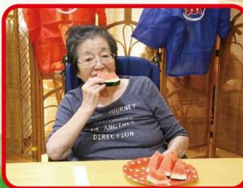
スイカ美味しいね