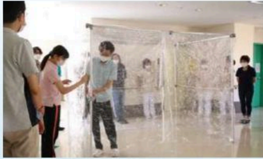
テント式簡易陰圧機の設置演習