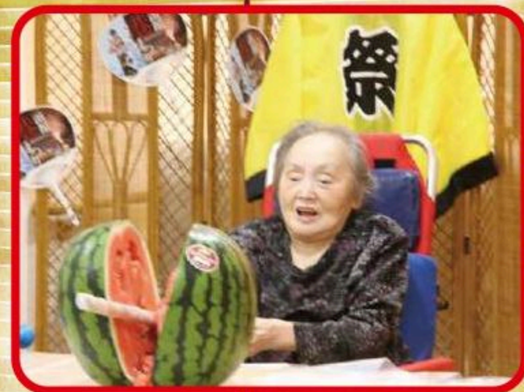
見事に割れました!