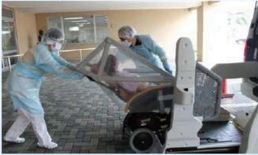
陽性者の搬送を想定した訓練

コロナウイルスを施設内に持ち込まないように対策し、陽性者が発生した場合に感染が広がらないようシミュレーションを行っています。